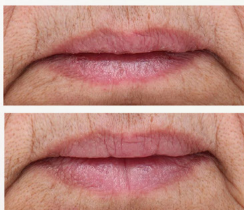
Figura 3: Aumento visível do volume dos lábios obtidos pelo Linefill

Linefill aumentou o volume labial em 23,1%.