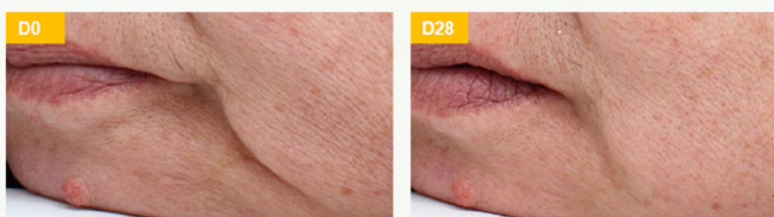
Figura 2: Diminuição visível das rugas laterais obtida com o Linefill

Linefill aumentou o volume labial em 23,1%.